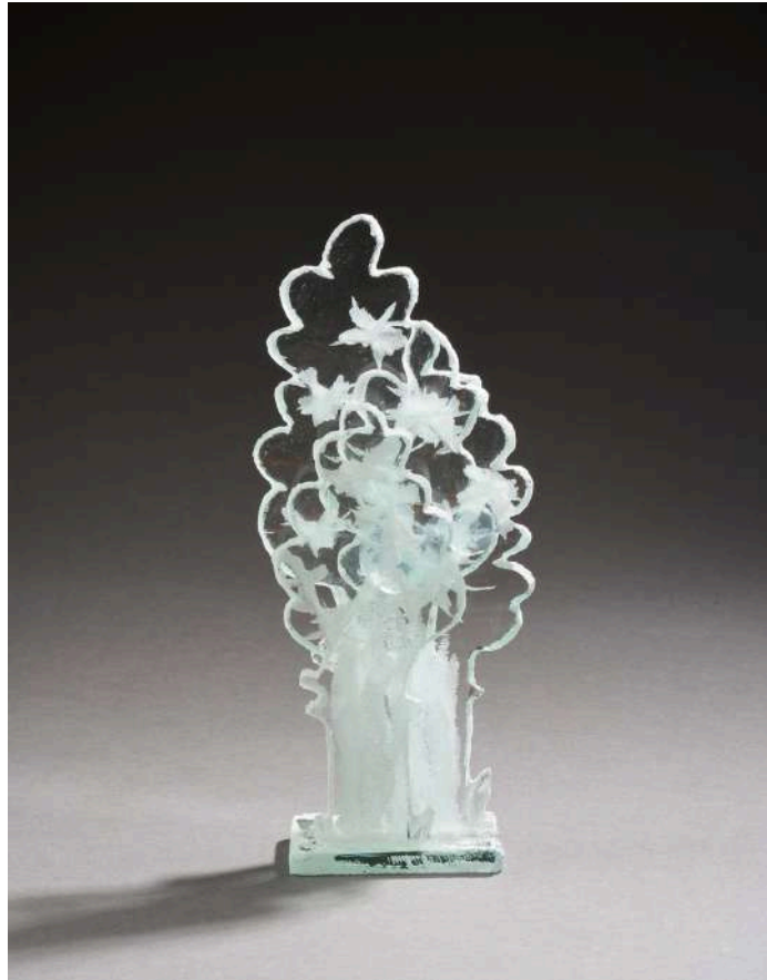
Trois arbres, 2022, verre découpé, sablé, gravé, 30x6x9cm