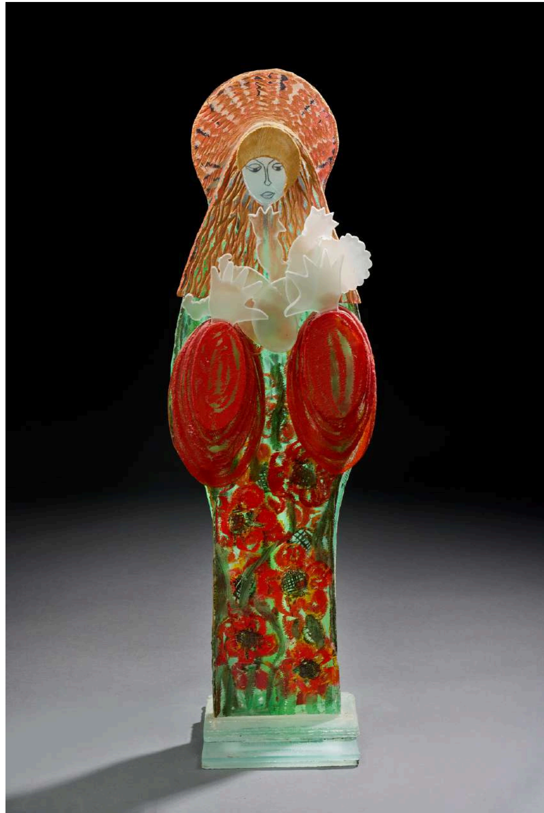
Vierge rouge , 2024, verre découpé, sablé, gravé, coloré, 94x28x22cm 15 000€