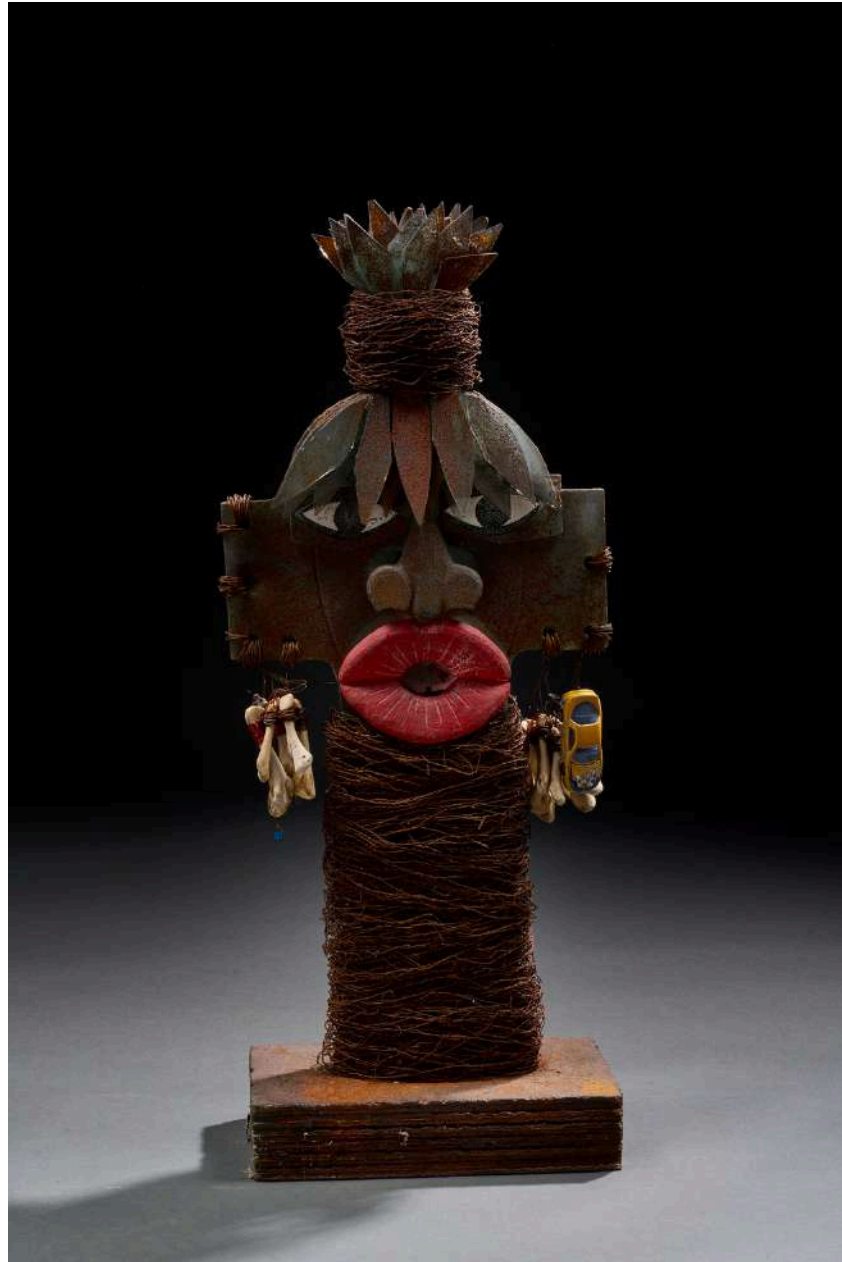
Africaine , 2019, verre découpé, sablé, gravé, coloré, 70x27x15cm