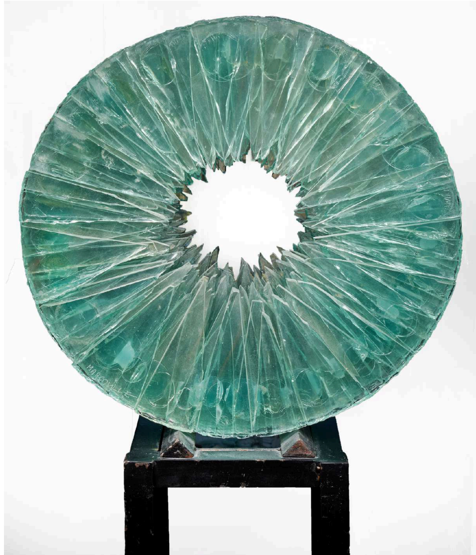
Tranche de lumière , 2020, verre découpé, sablé, gravé, diamètre 51cm, épaisseur 20cm