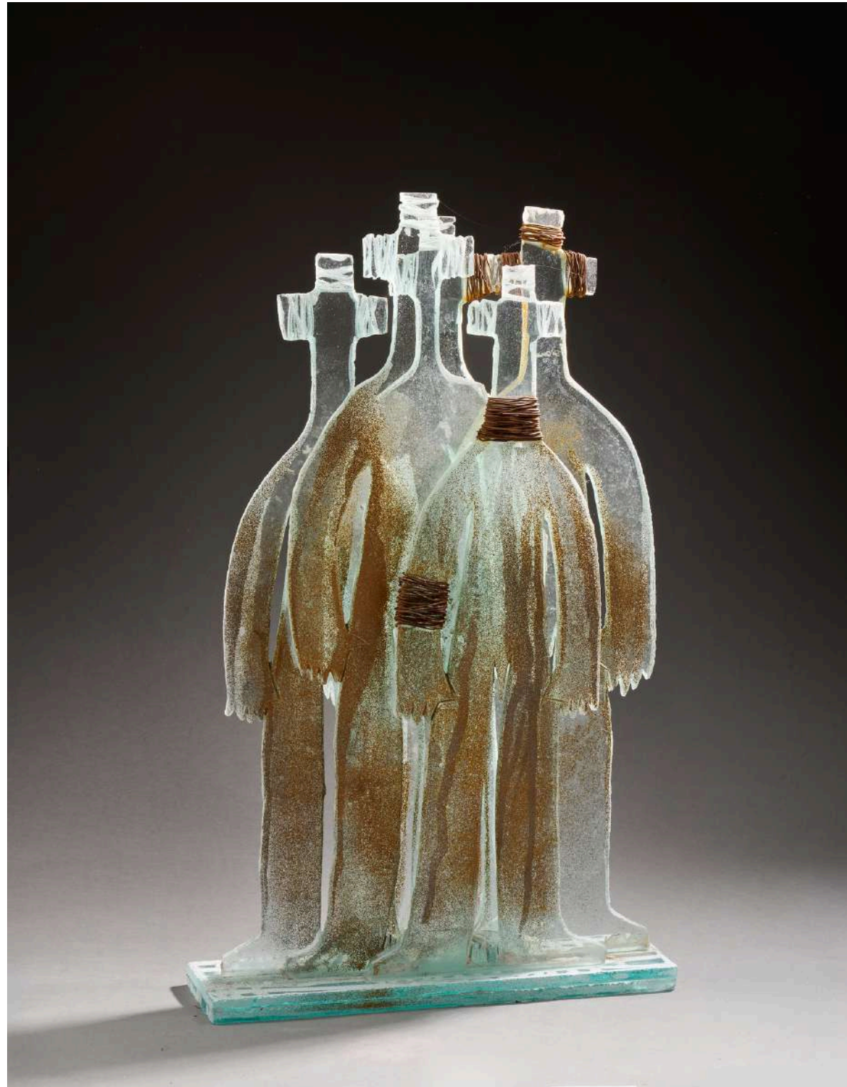
Tribu , 2018, verre découpé, sablé, gravé, coloré, 80x47x13cm 9 000€