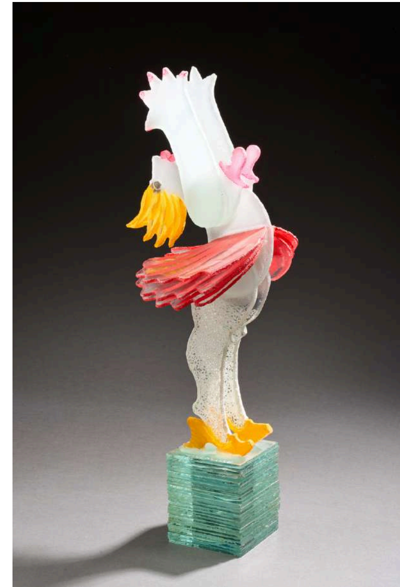
Il y a des jours où l'on se sent seul 2, 2018, verre découpé, sablé, gravé, coloré, 57x15x24cm