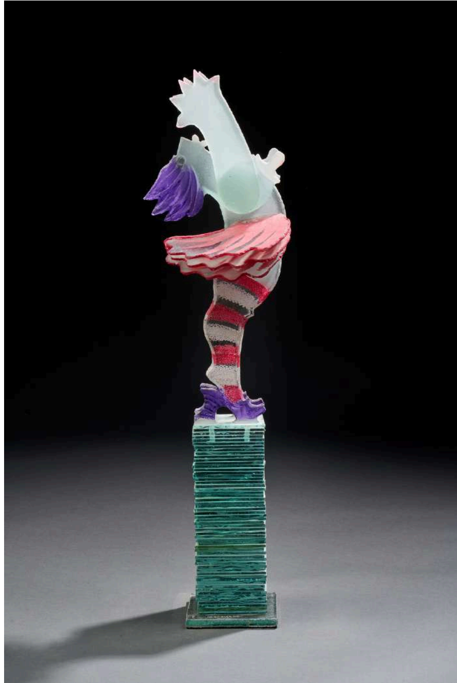
Il y a des jours où l'on se sent seul 1, 2018, verre découpé, sablé, gravé, coloré, 71x15x24cm