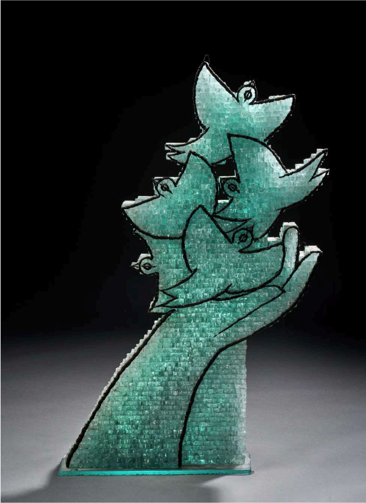
Cinq colombes, 1990, verre découpé, sablé, gravé, 85x56x9cm