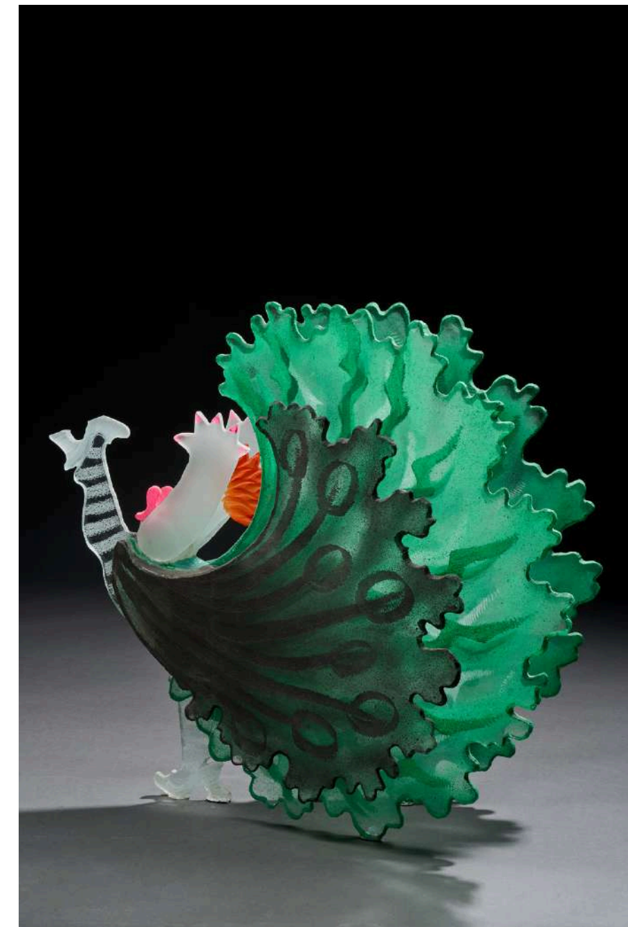
Cancan verte et grise , 2019, verre découpé, sablé, gravé, coloré, 55x65x35cm