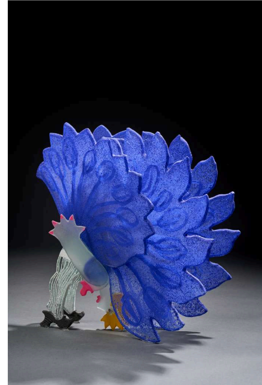
Cancan bleue , 2015, verre découpé, sablé, gravé, coloré, 47x50x32cm 15 000€