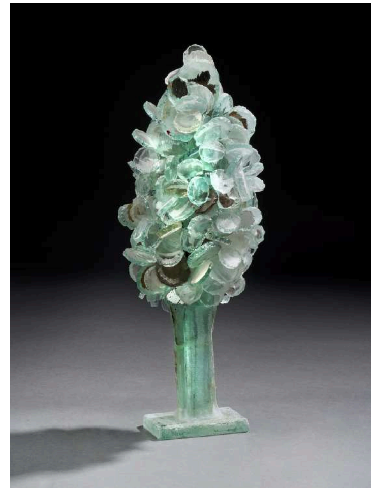
Arbre de verre, 2023, verre découpé, sablé, 48x20x15cm