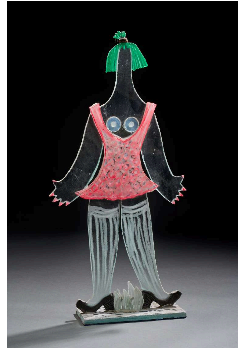
Nana plate gilet rose, 2020, verre découpé, sablé, gravé, coloré, 81x40x11cm