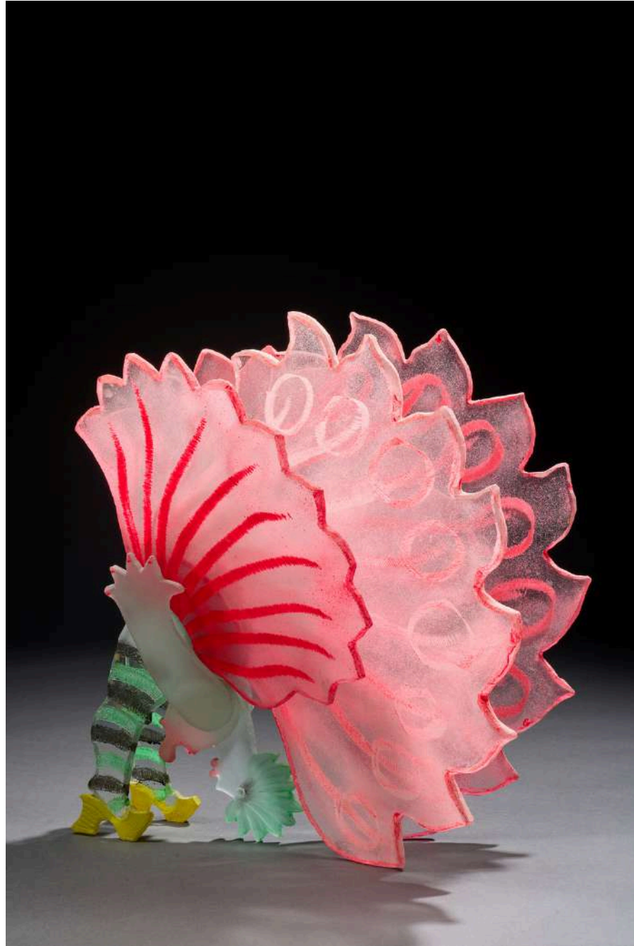
Cancan rose , 2014, verre découpé, sablé, gravé, coloré, 50x46x30cm 15 000€