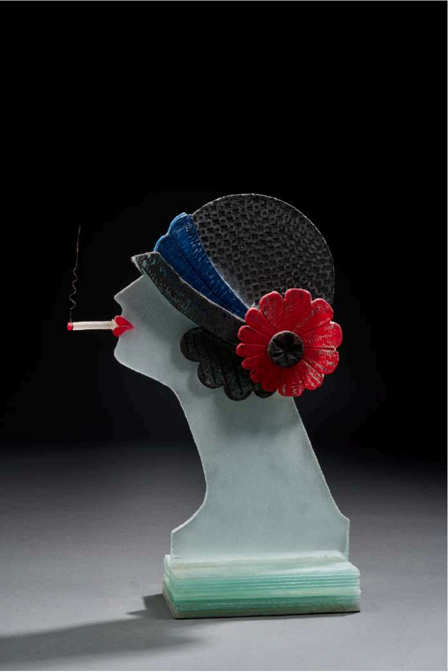
Coco Chanel, 2014, verre découpé, sablé, gravé, coloré, 55x38x13cm