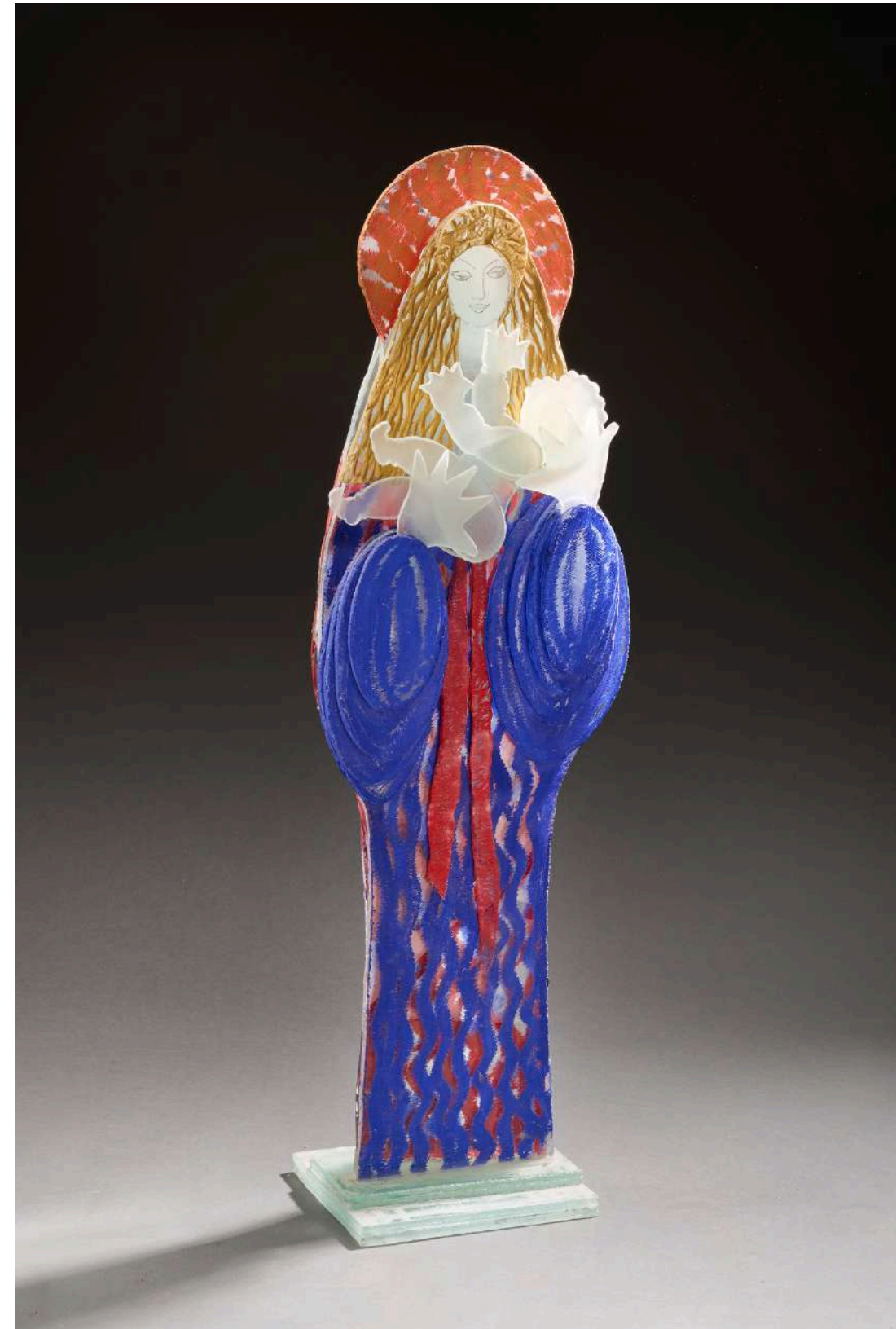
Vierge bleue , 2024, verre découpé, sablé, gravé, coloré, 94x30x21cm 15 000€