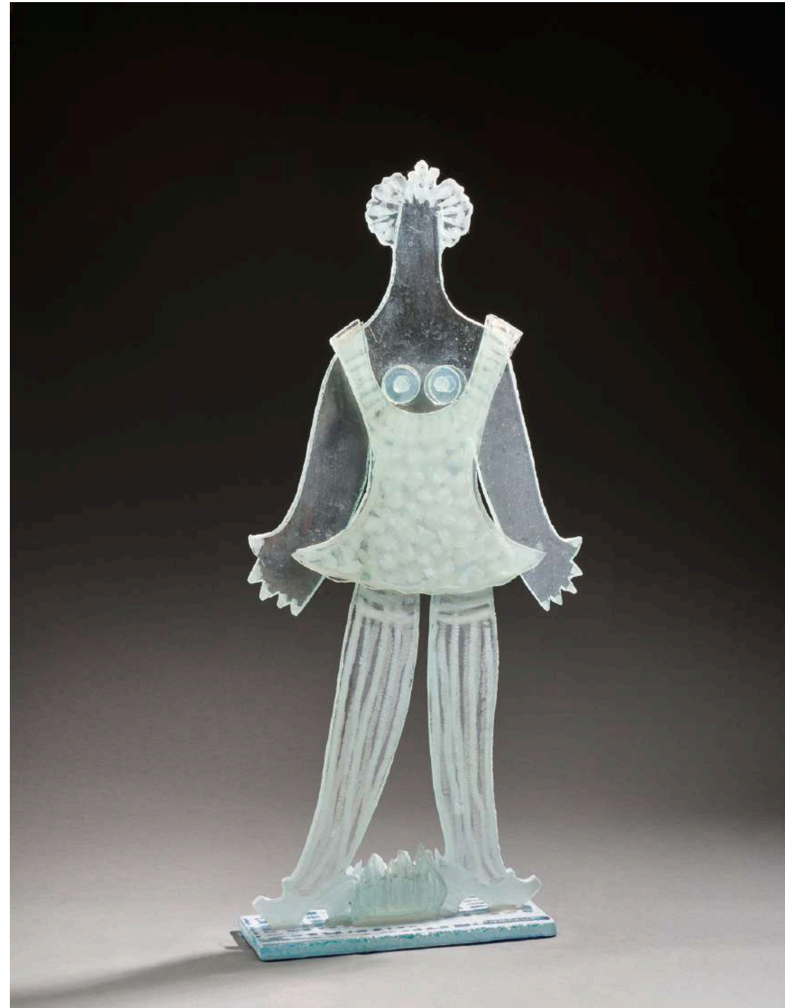
Nana plate transparente 1, 2020, verre découpé, sablé, gravé, 82x39x10cm 7 000€