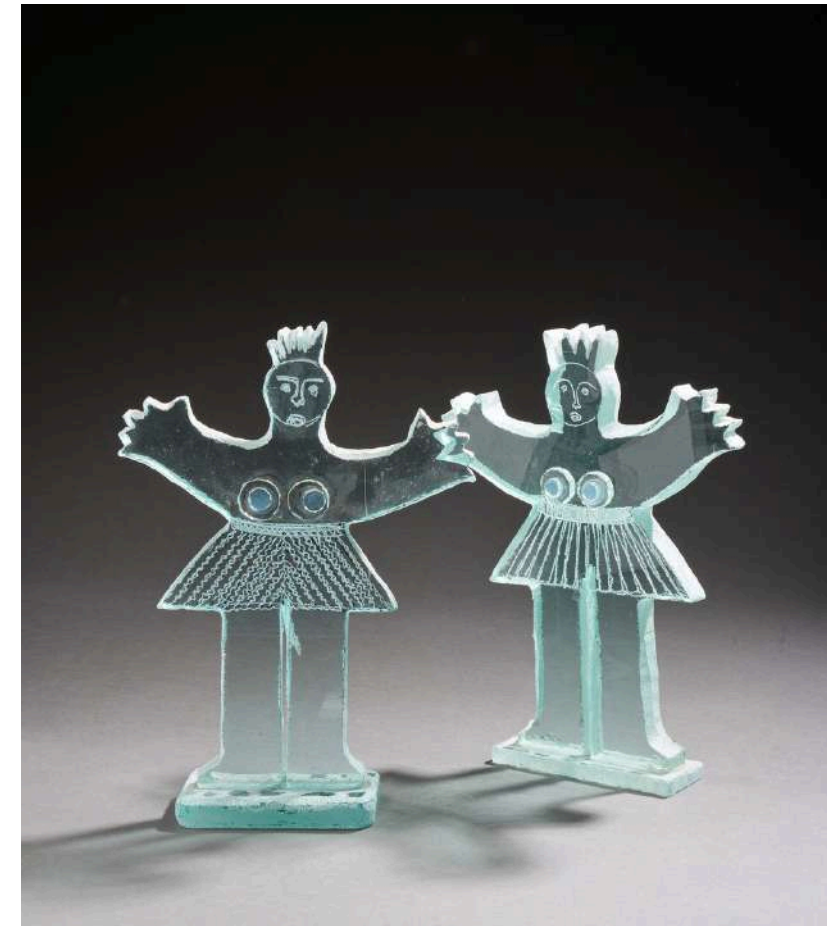
Deux nanas en perdition , 2021, verre découpé, sablé, gravé, 31x22x8cm 4 000€ chaque