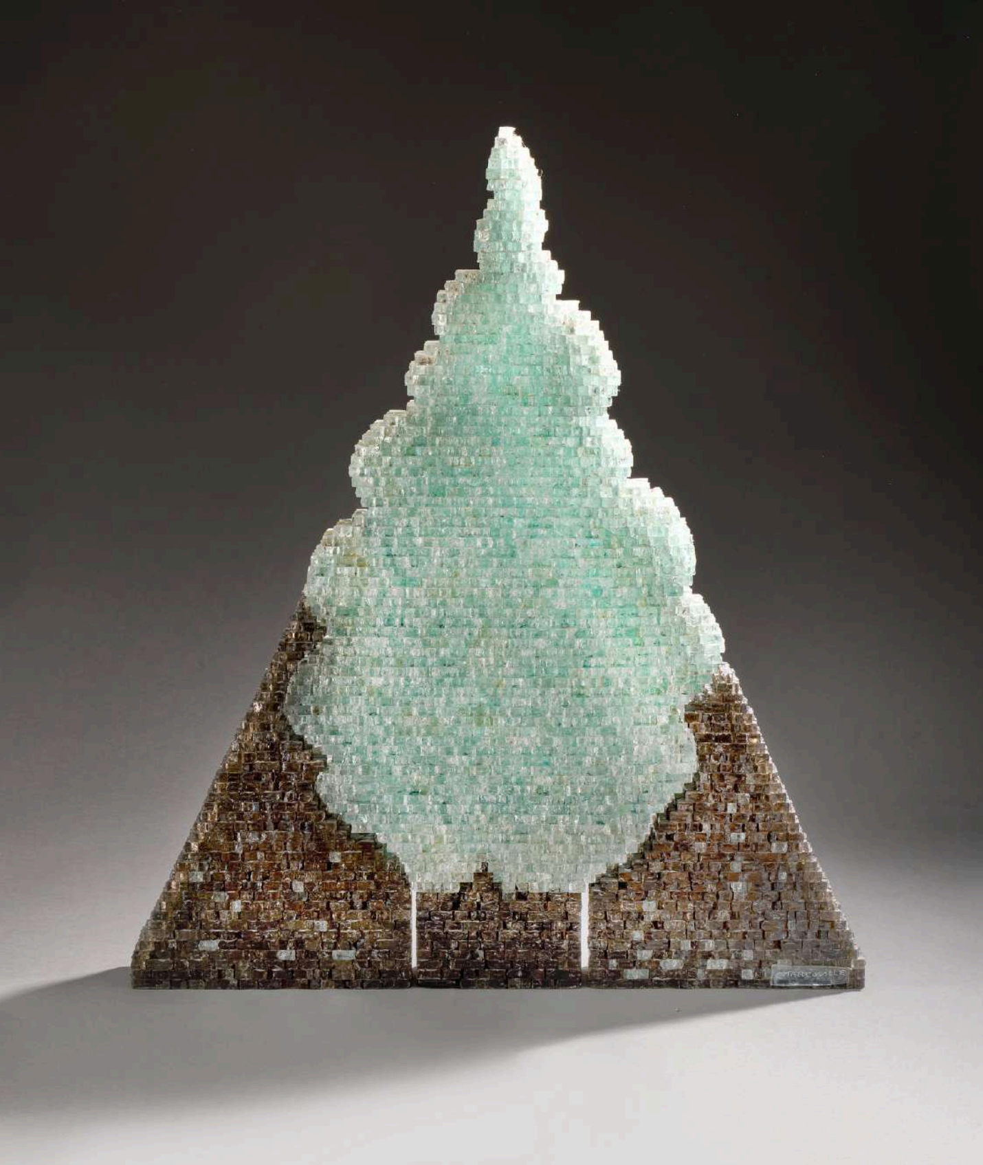
Arbre Securit, 1990, verre découpé, sablé, gravé, 86x74x8cm