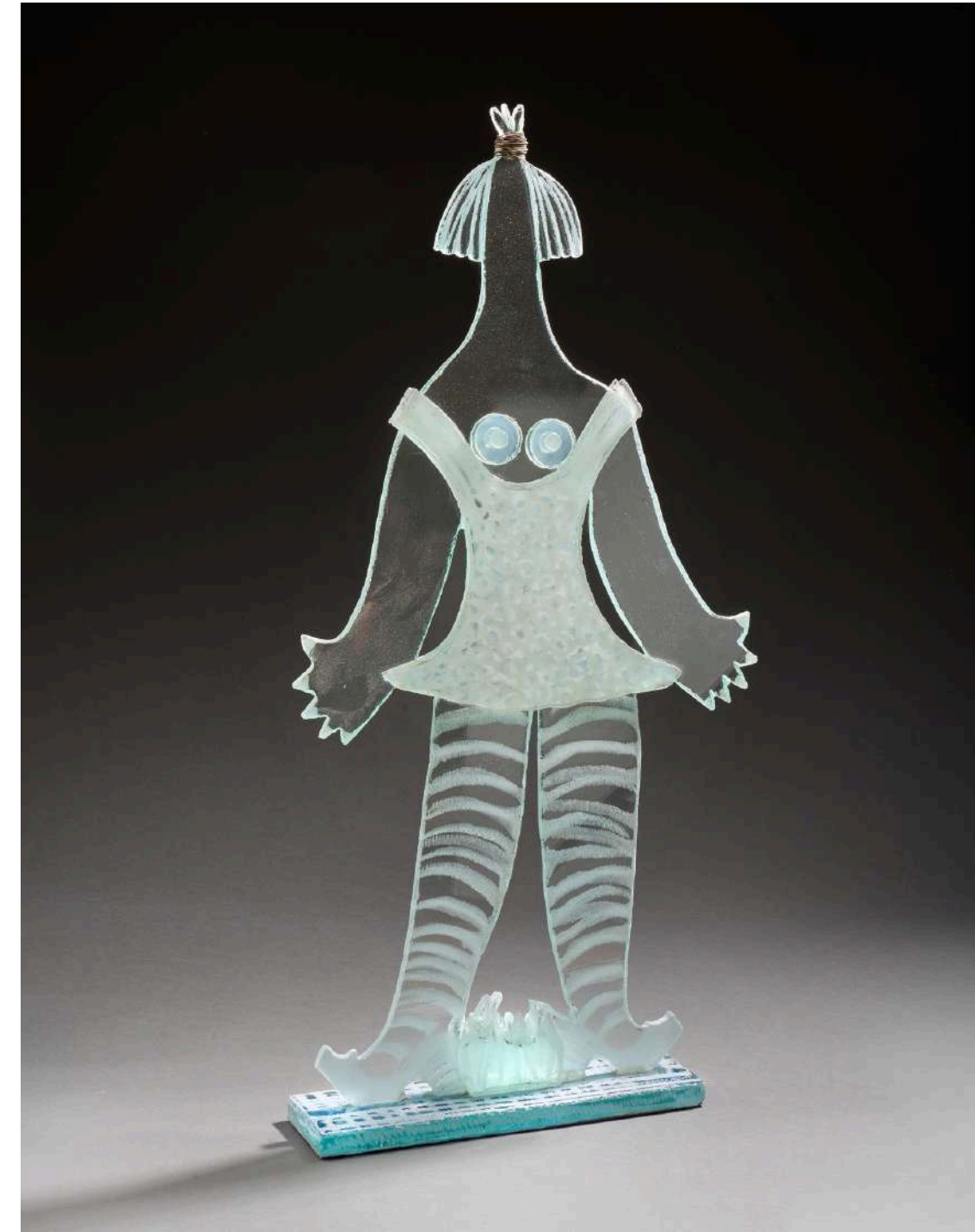
Nana plate transparente 2, 2020, verre découpé, sablé, gravé, 82x39x10cm 7 000€