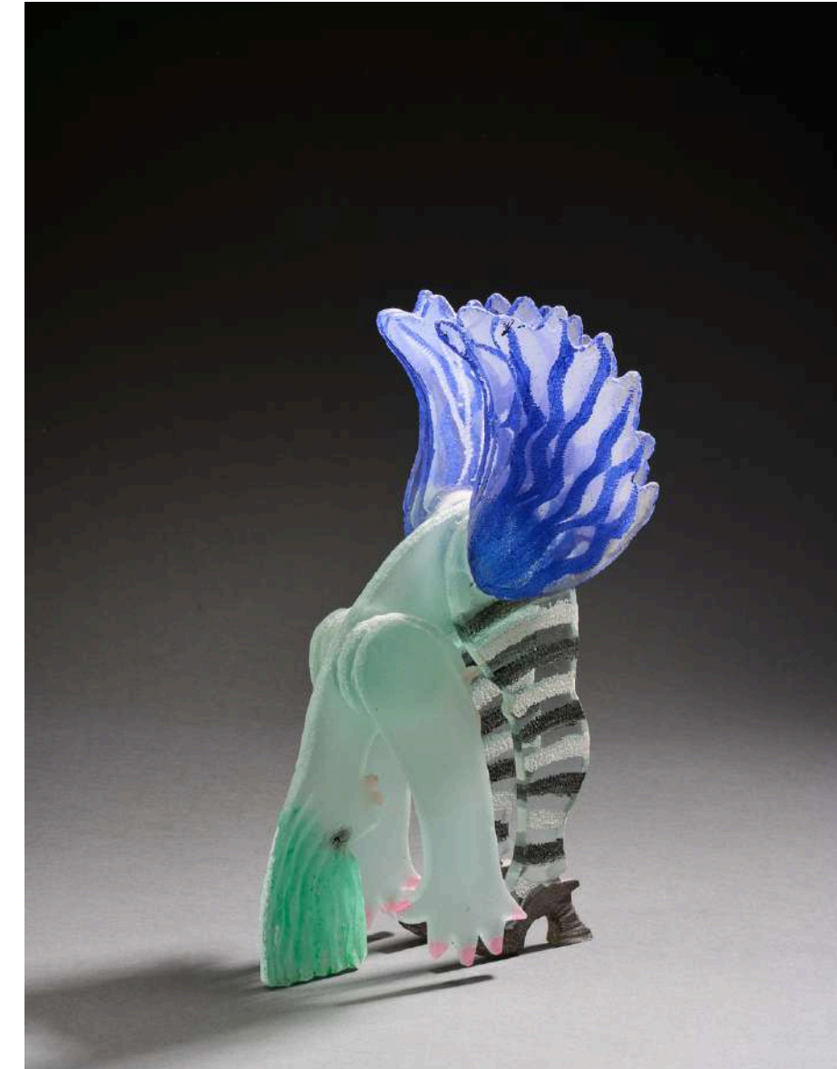
Nana penchée , 2020, verre découpé, sablé, gravé, coloré, 37x20x9cm 7 000€