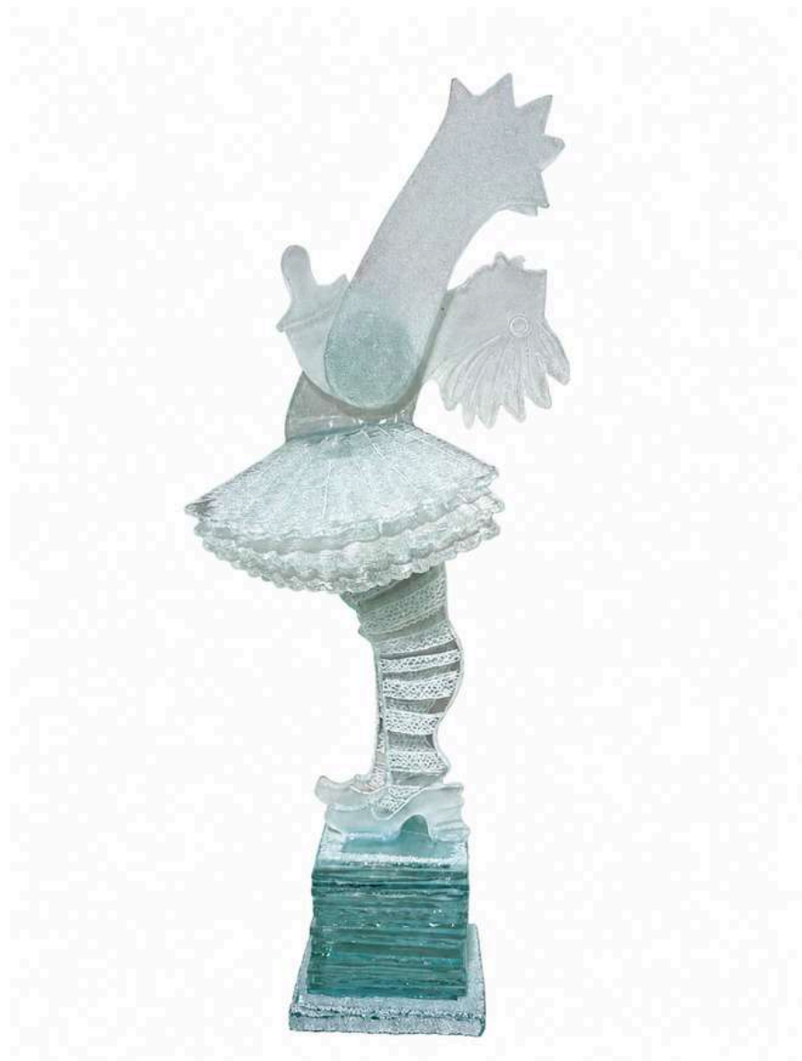
Il y a des jours où l'on se sent seul 3, 2018, verre découpé, sablé, gravé, coloré, 57x15x24cm